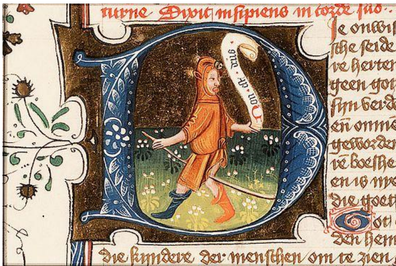
Nar, afgebeeld in eerste historiebijbel, circa 1450, 's-Gravenhage: Koninklijke Bibliotheek, 78 D 38.

Carnaval heette lange tijd 'vastelavont'. Het woord vastel zou teruggaan op fazel = onzin, kletspraat, uitwendig geslachtsdeel en fokken. Het zou refereren aan vruchtbaarheid en onzinnigheid. Het woord carnaval werd pas voor het eerst in 1673 gebruikt en wel in het tijdschrift De Hollandse Mercurius . Sommigen herleiden het tot carne vale = vlees vaarwel (een ritueel om de vastentijd in te luiden). Anderen herleiden het tot carnevale = opruiming, opvrolijking van vlees, of tot carne (vlees) valere (regeren): de tijd dat het vlees regeert. Weer anderen menen dat het komt van carrus navalis = scheepswagen (naar het op een kar geplaatst schip dat in een cultushandeling werd rondgedragen).