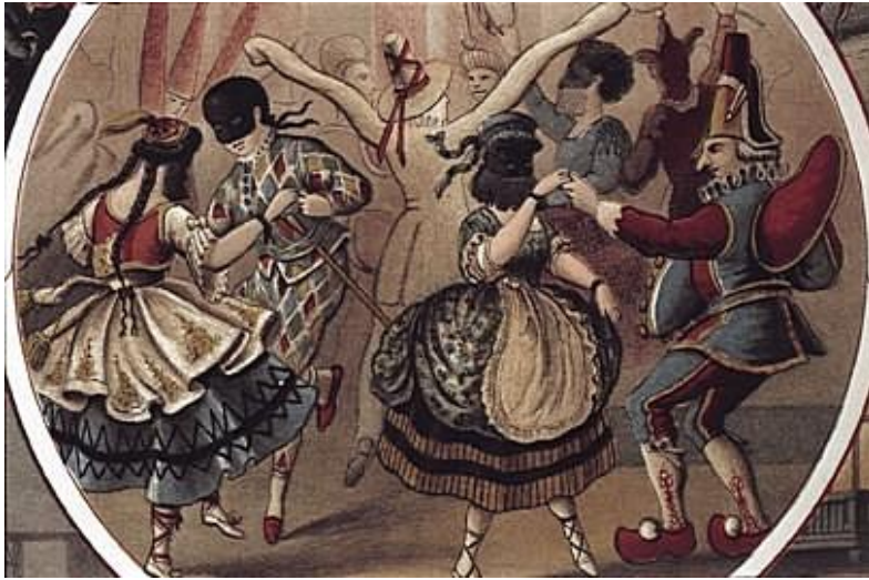
Eind negentiende eeuw werd in Noord-Nederland nog steeds carnaval gevierd, zij het in balzalen met genodigden. Uit: Pieter Jacob Andriessen, Kinderfeesten , Amsterdam: Leendertz. .1876.

Vanuit Keulen verspreidde de nieuwe, georganiseerde vorm van viering zich via de Franse soldaten over grote delen van Europa. In 1839 werd in Maastricht carnavalsvereniging Momus opgericht, in 1842 in Venlo Jocus. Veel plaatsen in Limburg en enkele in Noord-Brabant volgden. Pas na de